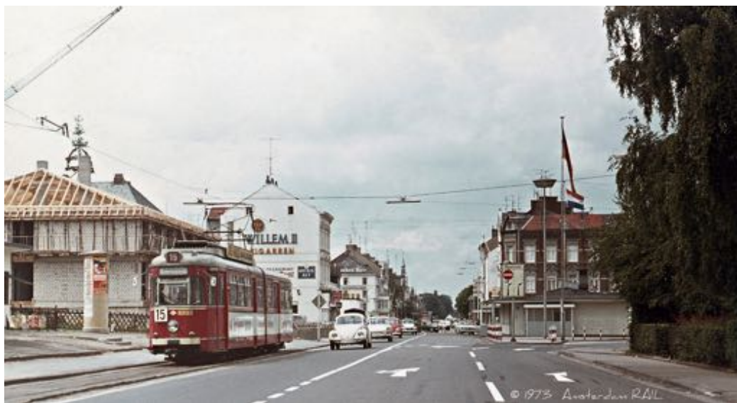
Grensovergang Vaals, zomer 1973