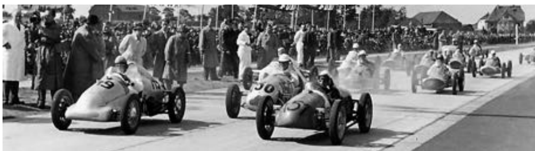
Grenzlandring-Wegberg 1950, Jos met startnr. 151 op de eerste rij.

U kunt t/m 1 juni inschrijven, door overboeking van € 12,50, op bankrekening nr. NL23RABO0114493979 t.n.v. Heemkunde St. Tolbert Vaals - Jos Göttgens onder vermelding van Uw naam en adres. Indien U het wenst toegezonden te krijgen is de prijs € 17,00. Het boek Jos Göttgens kost na voorinschrijving vanaf 1 juni € 17,00 excl. verzendkosten.