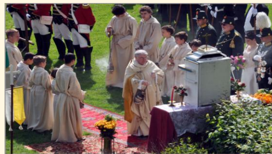
Op de foto: Rustaltaar bij de Morettiflat tijdens de BROONK van 13 juni 2010.

Elk jaar weer trekt in de weken na Pinksteren de Sacramentsprocessie door alle dorpen in de gemeente Vaals. Waar komt 'Broonk' vandaan? Aangenomen wordt dat broonk(en) is afgeleid van proonk(en). Onder proonken wordt verstaan schitteren, stralen, maar ook: zich opvallend uitgedost in het openbaar vertonen. Beide elementen zijn zeer zeker van toepassing op de Sacramentsprocessie. Op de eerste plaats de processie zelf. De plechtige ommegang waarbij de pastoor in een van zijn mooiste gewaden, geflankeerd door andere heren, bedienaren van de kerk en geloofsgenoten het Heilig Sacrament aan het volk toont. Een waarlijk pronken met Christus. Op de tweede plaats de omgeving waarin de processie wordt gehouden. Kerk, dorp en in het bijzonder de processieroute worden uitbundig versierd. De processie trekt door versierde straten, over bloementapijten, langs