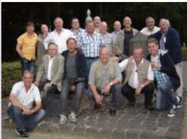
Foto: leden van de Loterijclub Vriendenkring 2016