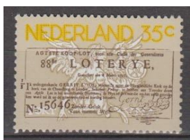
Postzegel 250 jaar Staatsloterij (1976)

In deze en nieuwsbrief 86 een beknopte samenvatting uit de kroniek van loterijclub Vriendenkring Vaals, van 1948 tot 2003. Ongetwijfeld voor velen onder u een moment van herinnering of herkenning aan het verenigingsleven in het Vaals van de vorige eeuw, de tijd dat Vaals nog een bloeiend verenigingsleven kende waaronder niet alleen grote maar ook veel kleine verenigingen en vriendclubs. Let u vooral op de humoristische wijze waarop vaak verslag werd gedaan van bijeenkomsten en activiteiten. Arthur Cransveld