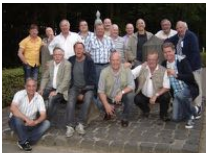
Foto: leden van de Loterijclub Vriendenkring 2016

14-2-1962 algemene jaarvergadering (karnaval staat voor de deur) een oude traditie zal in ere worden gehouden, de organisatie van het halffastenfeest.