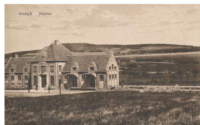
Station van de L.T.M.