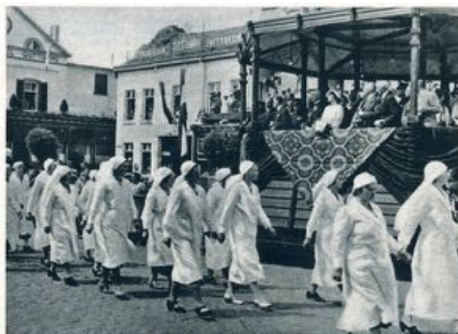
Tijdens het defilé te Vaals. — De prinses op de eeretribune. Geheel rechts Limburgs nieuwe gouverneur.