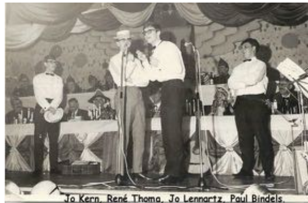
"Los Catastrofos" 1966

kwinkslag en een glimlach. LOS CATASTROFOS heeft bovendien bewezen ook serieuze onderwerpen te kunnen bezingen. Los Catastrofos in 1966 het jaar van hun oprichting, en ook deze zullen in hun jubileumprogramma niet ontbreken. Er zijn 2 voorstellingen in de “Obelisk” met, om de intieme sfeer te behouden, een beperkt aantal kaarten per voorstelling: zaterdag 18 juni 20.00 uur en zondag 19 juni 17.00 uur. Entree: Euro 10,-. Voorverkoop uitsluitend bij ZERA. In tegenstelling tot circulerende geruchten, er zijn nog, zij het beperkt, kaarten verkrijgbaar.