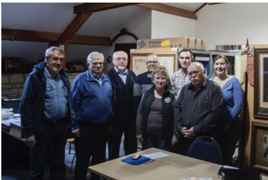
Acht van de tien leden van de archiefgroep