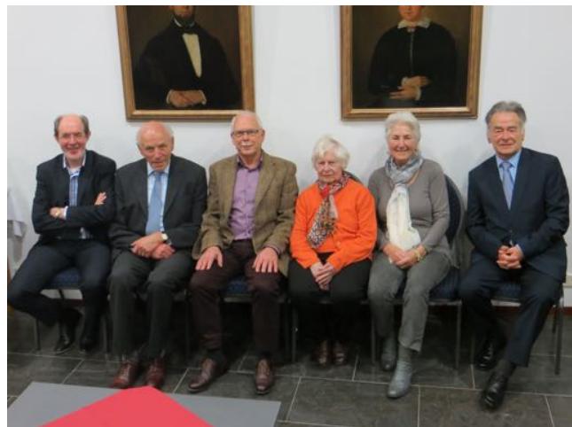
Onze jubilarissen van 2015