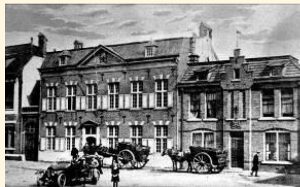
(Rechts op de foto politiebureau Wilhelminaplein 1917)

De nieuwe brandweerpost van Vaals komt naast het politiebureau aan de locatie Lemierserberg-Randweg. Die plek is het meest optimaal voor wat betreft veiligheid en tijd van uitrukken. Deze locatie zal echter vanuit architectonisch oogpunt een prijs hebben. Het politiebureau is ontworpen door de beroemde architect Wiel Arets. Voor het pand ernaast moet dus met de ontwerper worden overlegd. Al valt de architectuur van het politiebureau niet erg in de smaak van de meeste Vaalsenaren, het is te hopen voor de brandweer(mannen) dat de functionaliteit hier de boventoon zal voeren.