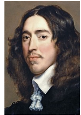
Johan de Witt

Wanneer: vrijdag 28 juni 19.30 uur Waar: HKK Sankt Tolbert, Bloemendalstraat 11A Vaals