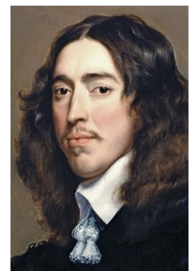
Johan de Witt

Wanneer: vrijdag 28 juni 19.30 uur Waar: HKK Sankt Tolbert, Bloemendalstraat 11A Vaals