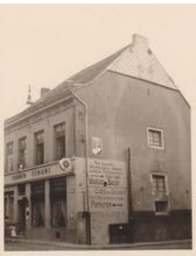
Schatüll met Souren-Schijns 1949-1952

Dan nu de publicatie, waarbij nu nog enkele afbeeldingen zijn toegevoegd.