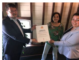
Uitreiking aan De Noabere va Viele

zusterverenigingen uit Vijlen "De Noabere va Viele" en uit Lemiers "De Auw Kapel" streven wij als heemkundeverenigingen uit de "Drielandengemeente" ernaar mede vorm te geven aan de filosofie van Cittaslow door onderzoek te verrichten naar heemkundige vraagstellingen, het verzamelen en archiveren