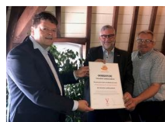
Uitreiking aan De Auw Kapel Lemiers

geschiedkundige gegevens, alsmede het zich inzetten voor het behoud van cultuurhistorische objecten met betrekking tot en in de gemeente Vaals.