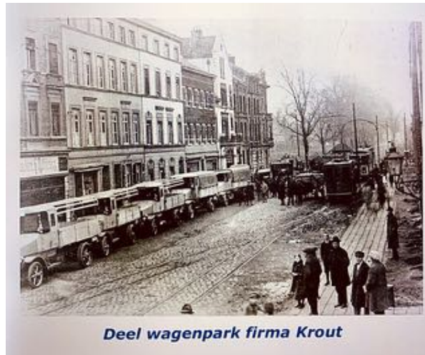
Deel wagenpark firma Krout