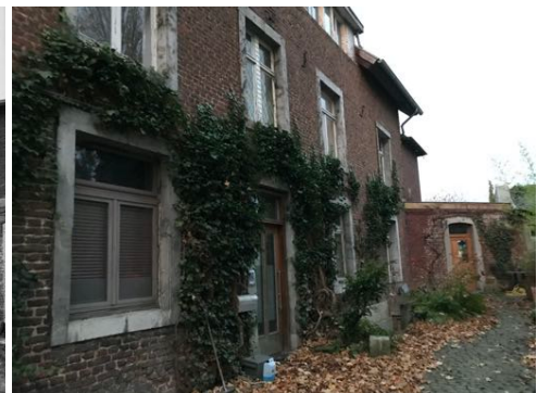
Uit een foto uit 1958 behoefde het pand nog wel een opknappbeurt (links), de foto rechts is van 2020