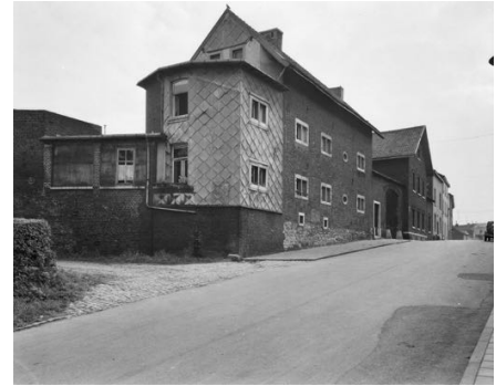
Het huidige pand Bloemendalstraat 7