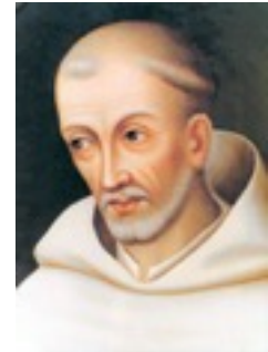
Hl. Bernhardus van Clairvaux