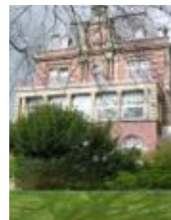
'Villa Monheim' - Altes Fakultätsgebäude der Fakultät für Elektrotechnik und Informationstechnik der RWTH Aachen