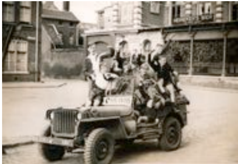
Wilhelminaplein 1944

De redactie spreekt de hoop uit dat zij met de serie artikelen uit ons eigen krantenarchief enkele bijzondere gebeurtenissen uit de jaren 1944 en 1945 in onze herinnering gebracht heeft. De reeks is met de vermelding dat Nederland bevrijd is ten einde gekomen. De herinnering aan deze verschrikkelijke tijd levend te houden is ook een taak van Heemkundekring Sankt Tolbert.