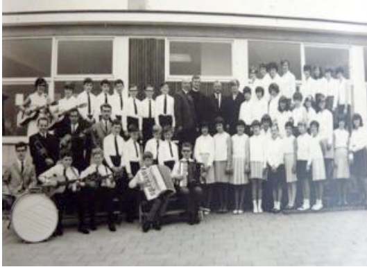
Het Mandoline orkest Vijlen rond 1950

Toen onze streek in het najaar van 1944 was bevrijd ontstond de behoefte aan ontspanning. Het LD van 20 januari 1945 vermeld hoe men af en toe de