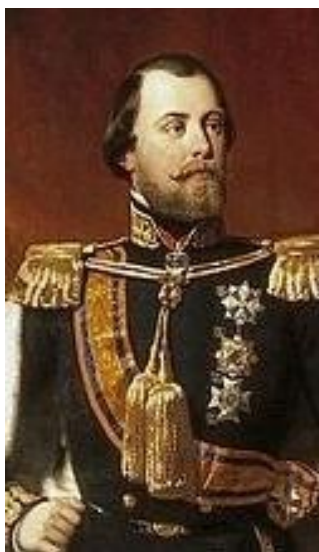
Koning Willem III

W I J W I L L E M III, bij de gratie Gods, Koning der Nederlanden, Prins van Oranje-Nassau, Groot-Hertog van Luxemburg enz. enz. enz.