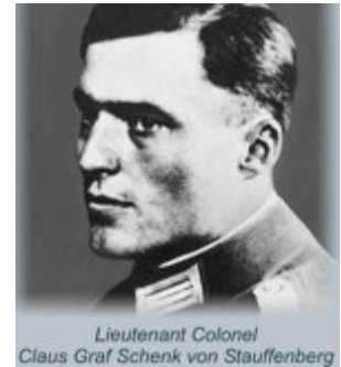
Lieutenant Colonel Claus Graf Schenk von Stauffenberg