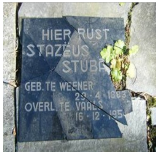
Zo zag zijn grafsteen uit voor de totale vernieling