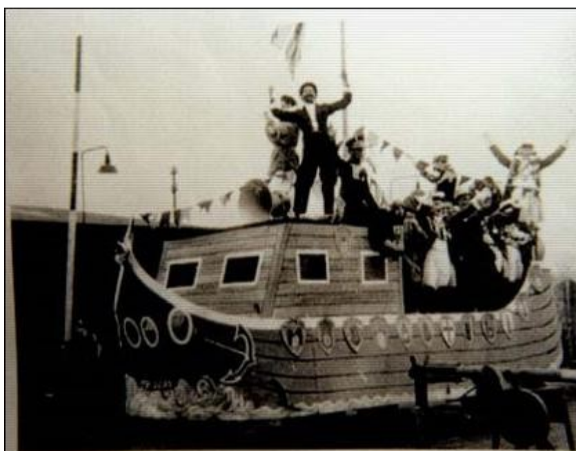
Blauw Sjuut aan de grensovergang in Vaals 1949