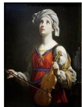
Schilderij St. Cecilia van Guido Reni

Het is een goede traditie dit naamfeest te vieren. Laten we dit ook in de toekomst blijven doen.