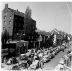
File op de Maastrichterlaan

Tijdens de reconstructie van de Maastrichterlaan is er regelmatig verkeersoverlast. Koning Willem I heeft de Maastrichterlaan laten aanleggen op verzoek van Vaalser industriëlen rond 1824. Men had er bij de koning op aangedrongen een betere verbinding te krijgen met Maastricht en het Nederlandse achterland. Dit in verband met de teruglopende markten en afzetgebieden. Sinds de aanleg van de Maastrichterlaan door Koning Willem I is er vaak iets veranderd aan de straat. Dit zal nooit tot veel overlast