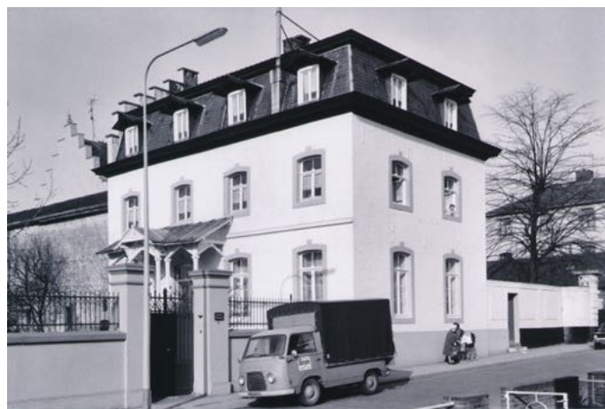
Voormalige ambts-woning van burgemeester Ruland; Tentstraat 69, Vaals.